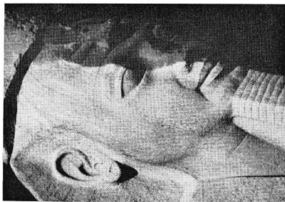
A - Un Ramsès de quartzite. Abords du pylône d'Amon.

Un inventaire complet des fragments recueillis a été établi. Des croquis d'étude, au 1/5, ont été effectués. Mais, pour la