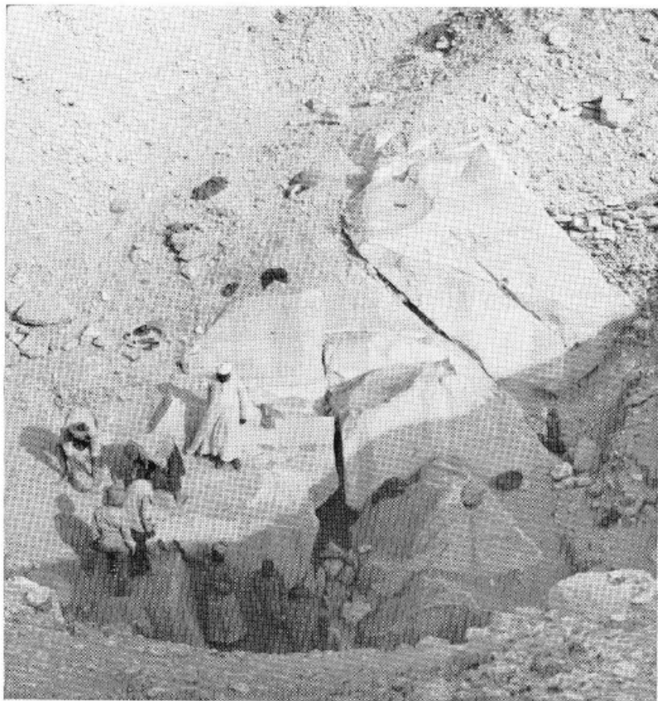
Saqqarah, 1966 - Le « noyau » de la pyramide de Pépi I er .