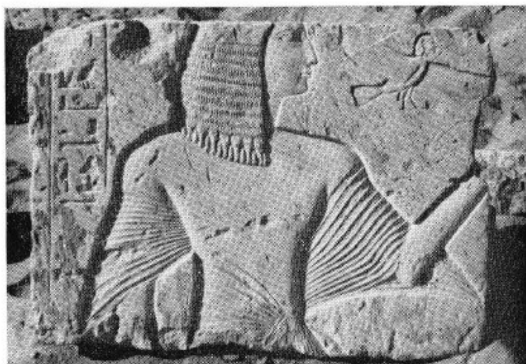
B - Fouilles de Saqqarah, 1966. Portrait d'Akh-pet.