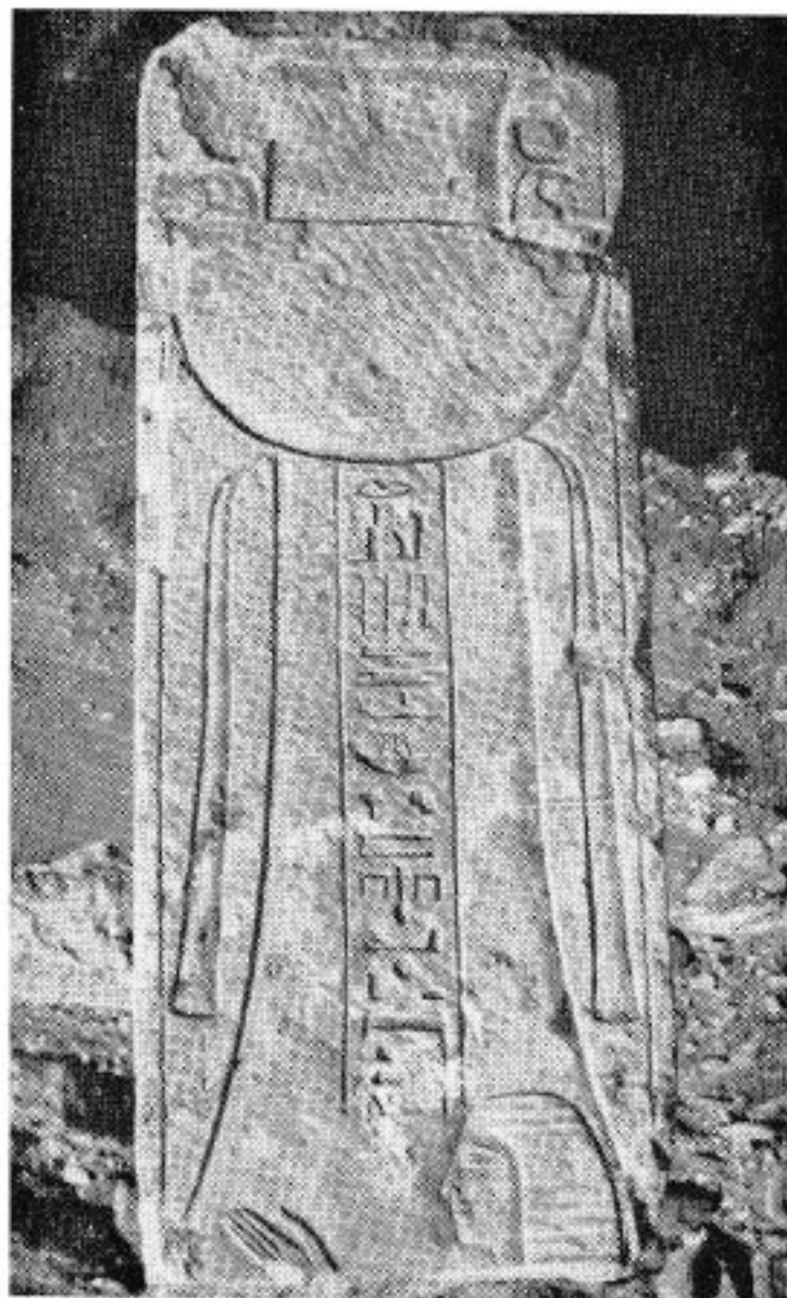
A - Fouilles de Saqqarah, 1966. Pilier de la sépulture d'Akh-pet.