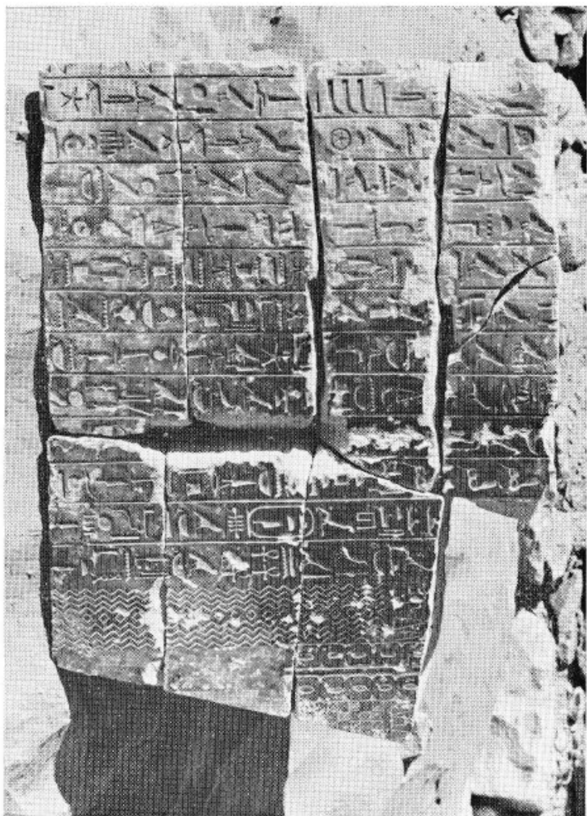
Saqqarah, 1966 - Pyramide de Téli - Reconstitution d'un fragment de paroi. (Caveau, paroi sud.)